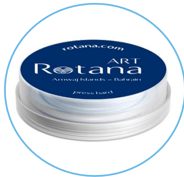
Rotana Art Hotel