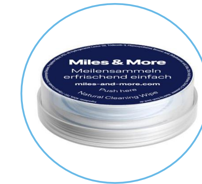
Miles & More